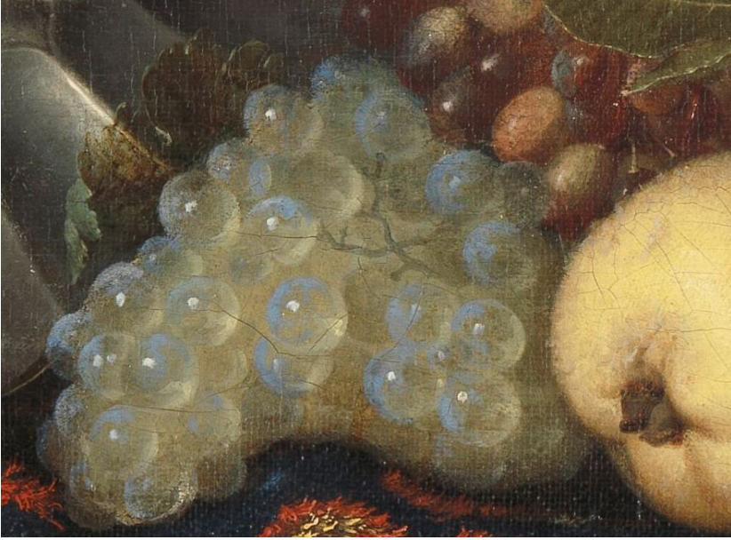
Simon Luttichuys (attributed to), Still Life with Fruit, Plates and Dishes on a Turkey Carpet (detail), 1650–1680