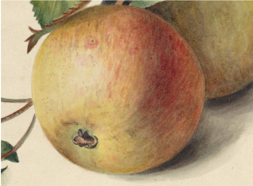
Johannes Reekers (II), Two Apples on a Branch (detail), 1834–95