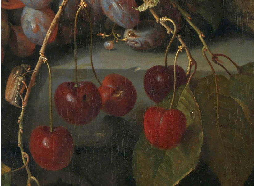
Jacob van Walscapelle, Still Life with Fruit (detail), c. 1670–c. 1727