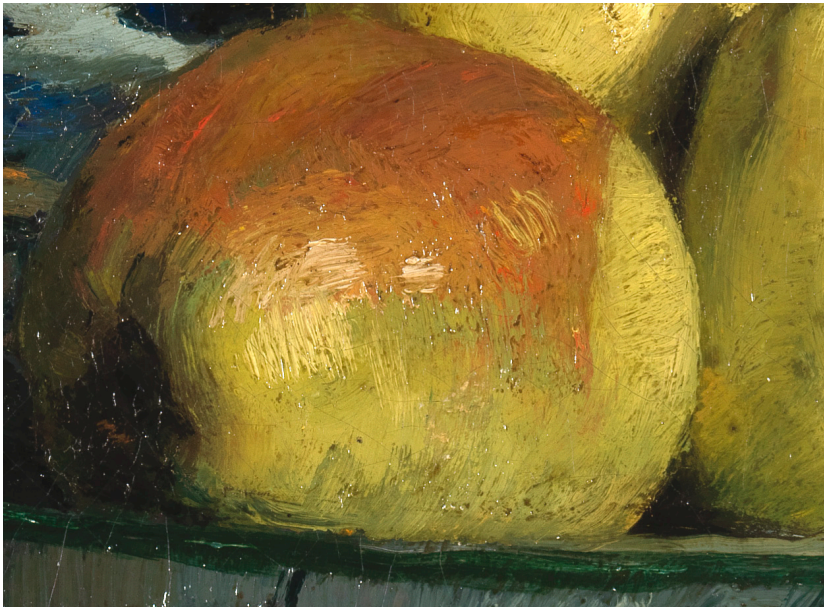
Willem de Zwart, Still Life with Apples in a Delft Blue Bowl (detail), 1880–90