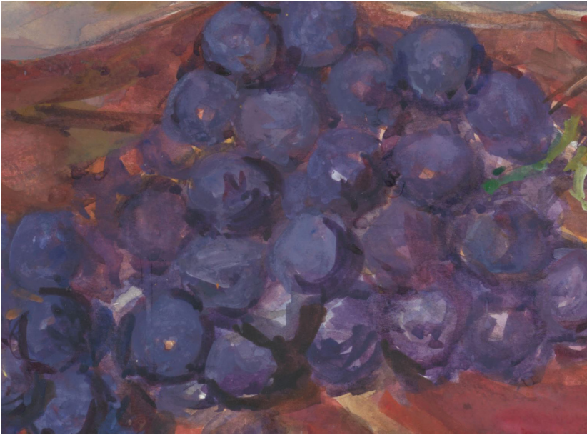
Elisabeth van Houten, Still life of pumpkins and grapes on a rug (detail), 1872–1950