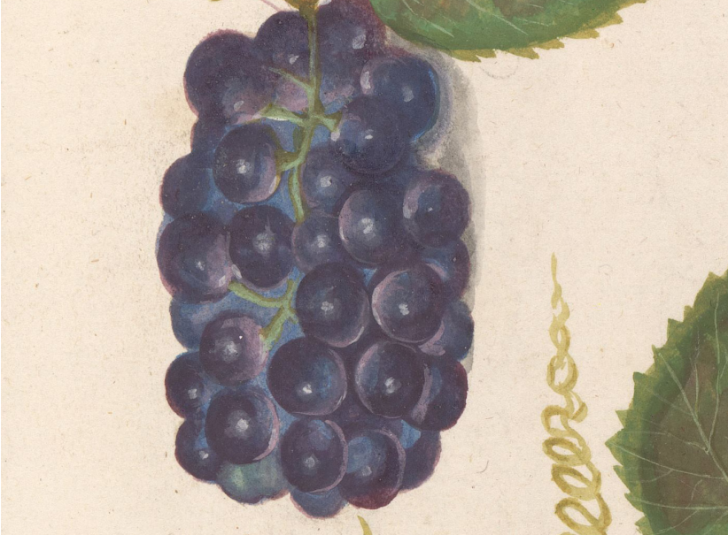
Anselmus Boëtius de Boodt, Grape ( Vitis vinifera ) (detail), 1596–1610