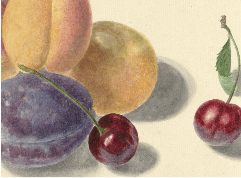
Elisabeth Geertruida van de Kastele, Peaches, Plums, Cherries, and Two Insects (detail), 1700–1800