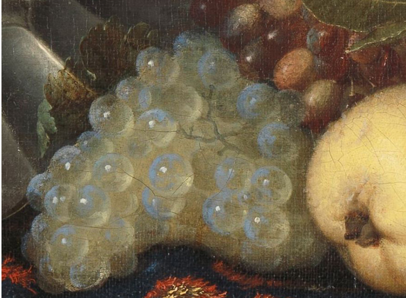
Simon Luttichuys (attributed to), Still Life with Fruit, Plates and Dishes on a Turkey Carpet (detail), 1650–1680