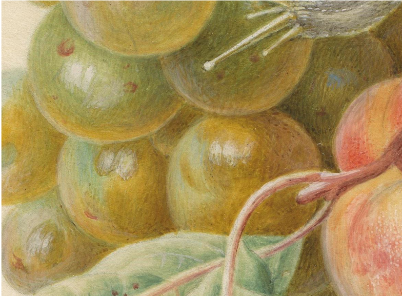
Herman Henstenburgh, Festoon of fruits (detail), 1677–1726